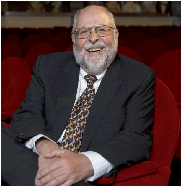
Dr. h.c. Klaus Tschira